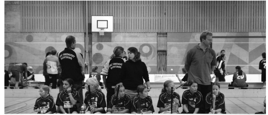
Impressionen der Saison