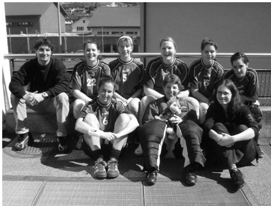
Team Damen 4