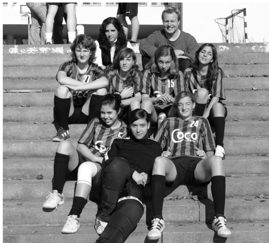
Team Juniorinnen B-Nord

Aufgrund des starken Teamgeists, der Motivation und dem Willen des ganzen Teams, das Maximum herauszuholen, sind wir als TrainerInnen überzeugt, dass wir gegen Ende der Saison noch zu einer Überraschung fähig sind.